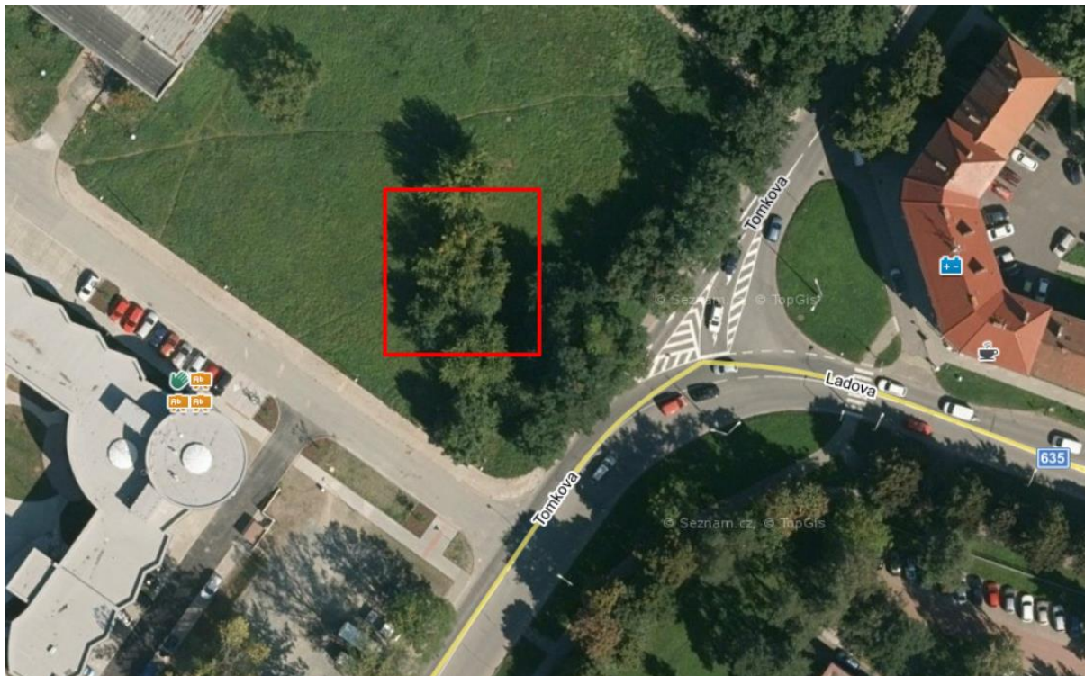
Schéma situace :

Výpočet a posouzení požadavků denního osvětlení byl zpracován v programu BuildingDesign. Požadavky jsou splněny. Navrhovaná novostavba galerie neovlivňuje stávající zástavbu dle požadavku na hodnotu D_w .